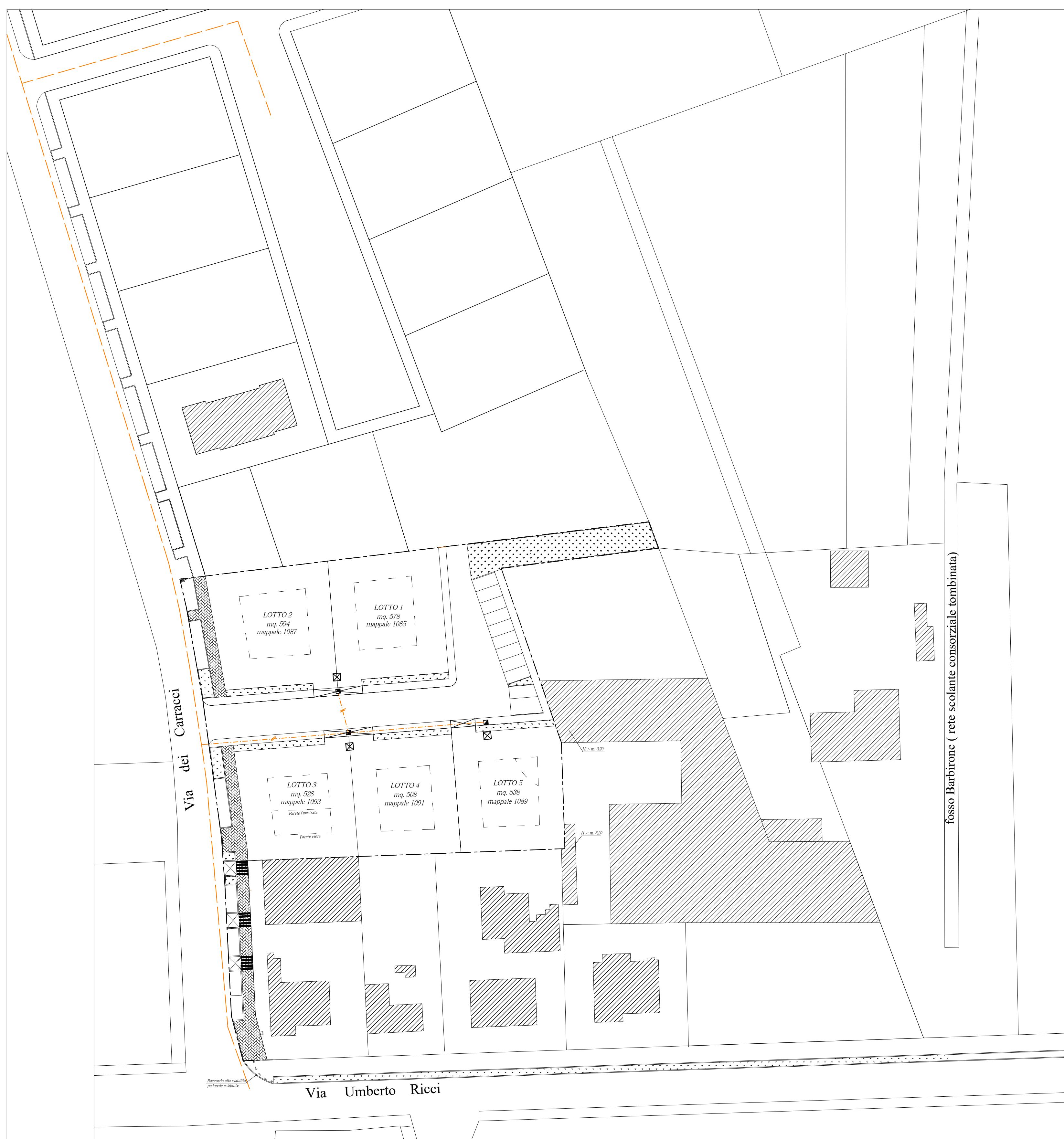
PLANIMETRIA Scala 1:500